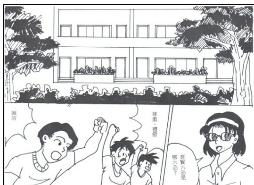
情境漫畫（單元四尊重）

一杯牛奶 一個生活貧困的男孩為了賺學費，挨家挨戶地推銷商品。 傍晚時，他感到疲憊萬分，饑餓難挨，而他推銷的卻很不順利，以至他有些絕望。這時，他敲開一扇門，希望主人能給他一杯水。開門的是一位美麗的年輕女子，她卻給了他一杯濃濃的熱牛奶，令男孩感激萬分。 許多年後，男孩成了一位著名的外科醫師。一位患病的婦女，因為病情嚴重，當地的醫師都束手無策，便被轉到了那位著名的外科醫師所在的醫院。外科醫師為婦女做完手術後，驚喜地發現那位婦女正